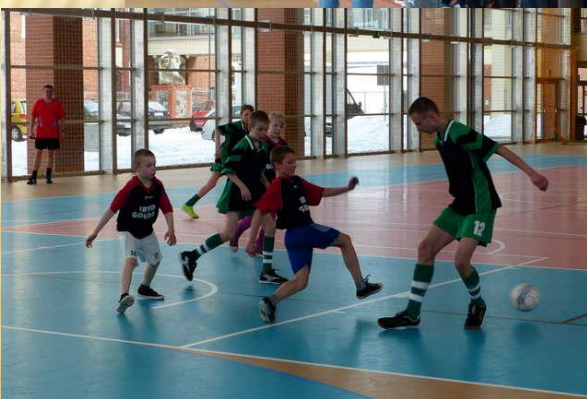
Z inicjatywy dyrektora giżyckiej placówki zorganizowany został I regionalny Turniej Piłki Nożnej Halowej „Zostańmy mistrzami”