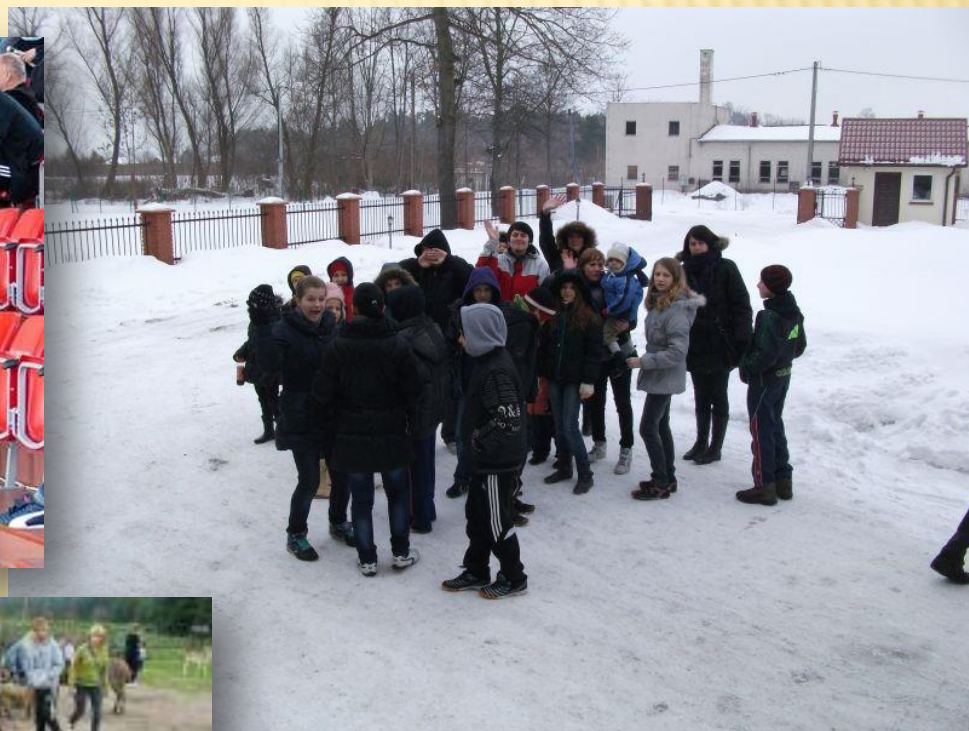
Wychowankowie Domu podczas kuligu