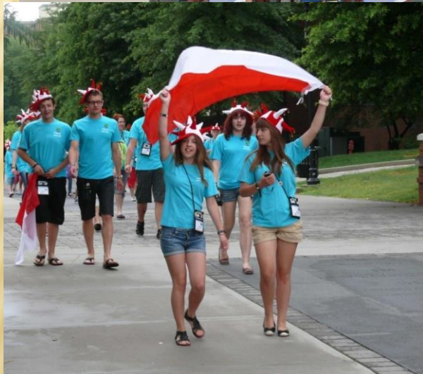
Światowa Olimpiada Kreatywności w Knoxville – USA