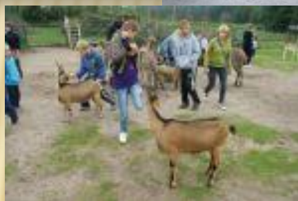
Letnia wycieczka do Parku Dzikich Zwierząt w Kadzidłowie